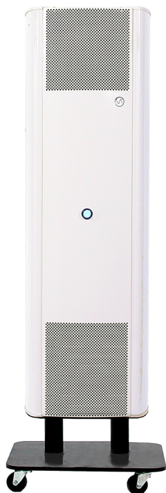
Modello su ruote (-ST)

La serie UV-FAN comprende una vasta gamma di purificatori da parete o su ruote (modello -ST), diversi in base alle potenze UV-C della lampade e alle dimensioni.