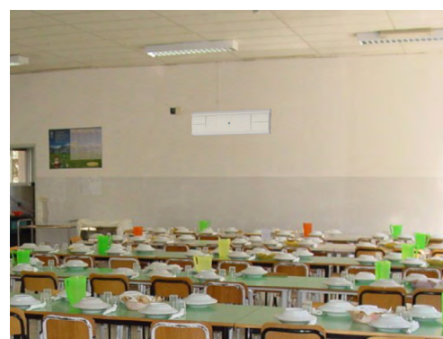
Esempio di applicazione

La tecnologia UV-C è un metodo di disinfezione fisico con un ottimo rapporto costi/benefici, è ecologico e, al contrario degli agenti chimici, funziona contro tutti i microrganismi senza creare resistenze.